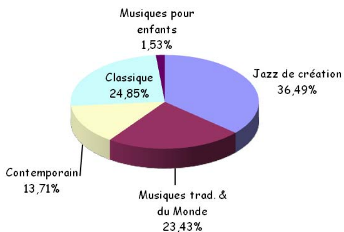
Disque : ventilation par genre des aides 2008